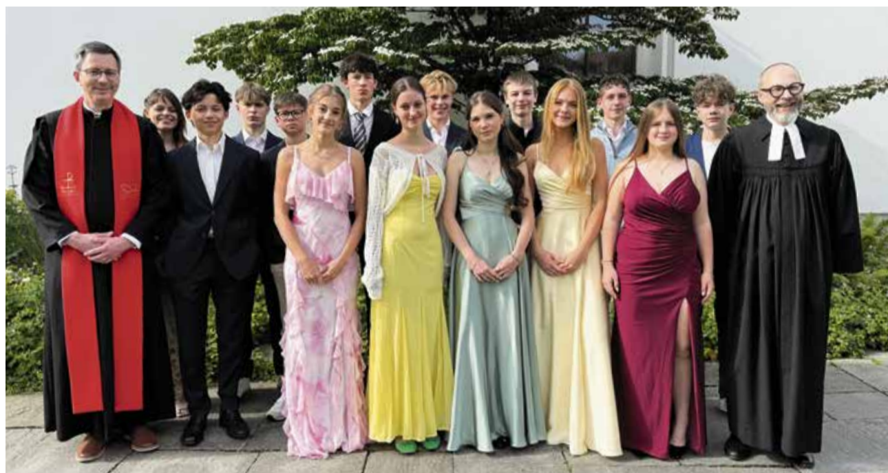
Konfirmationsklasse 2 vom 7. Juni – auch sie bei viel Sonnenschein fotografiert.