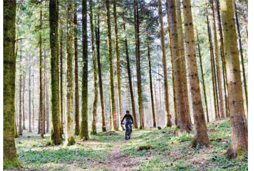
Auf Stollenpneus unterwegs: Bikerinnen und Biker haben den Wald nicht immer nur für sich allein.

Seit wenigen Monaten liegt das offizielle kantonale Mountainbike-Konzept