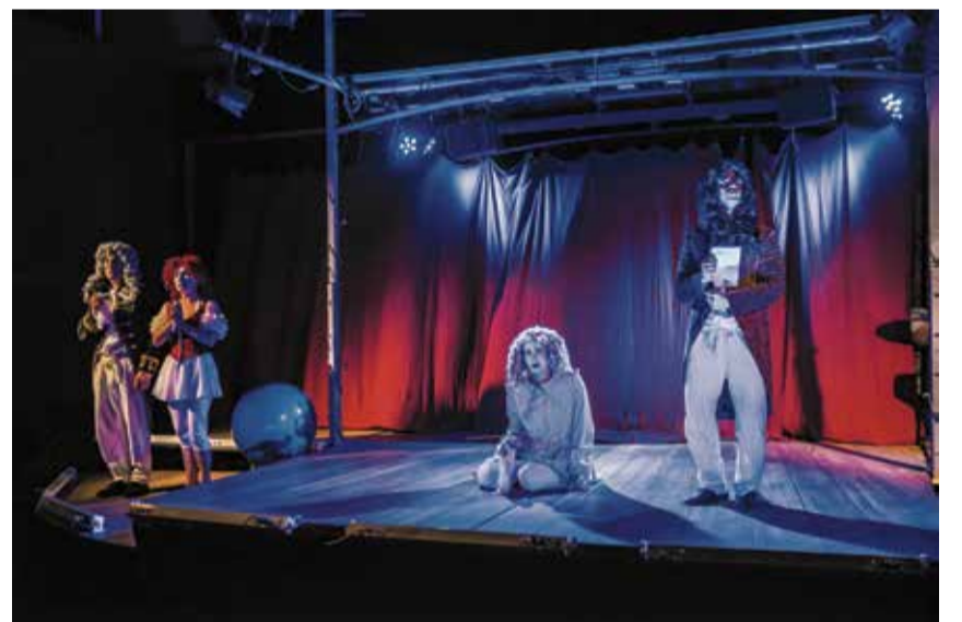
Molière vereint in Feldmeilen Künstlerinnen und Künstler aus unterschiedlichen Sprachregionen.