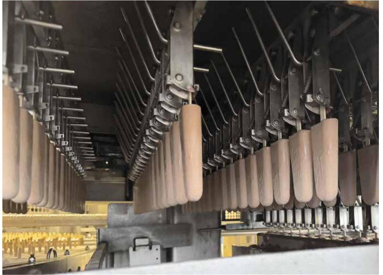
Die Kult-Lutscher «Bär» auf dem Weg ins Schokoladepad.