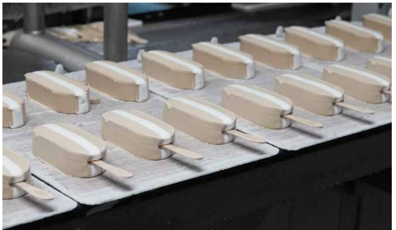
«MegaStar Cappuccino» ist eine von zehn MegaStar-Produkten, die in der Migros verkauft werden.