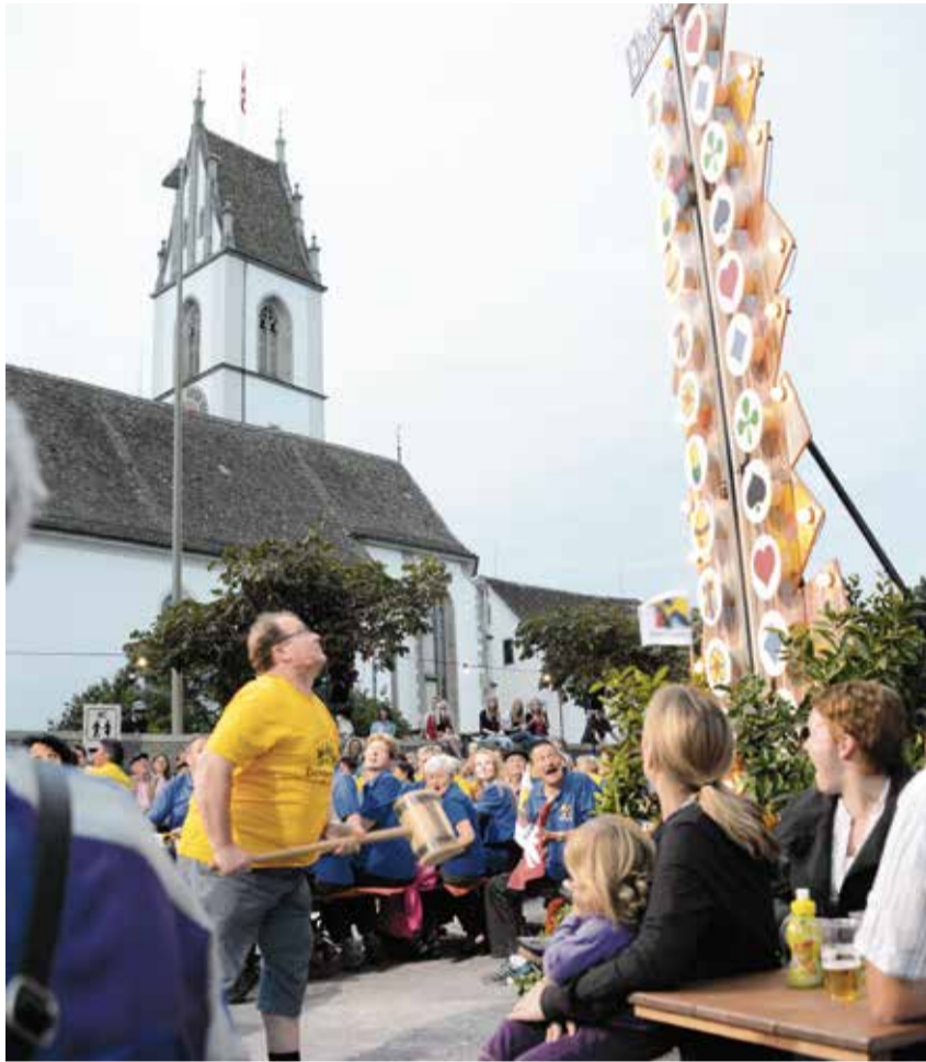
Gewinnen die Meilemer Jasserinnen und Jasser am 9. Juli im Luzernischen, kommt der «Donnschtig-Jass» nach 2012 erneut nach Meilen.