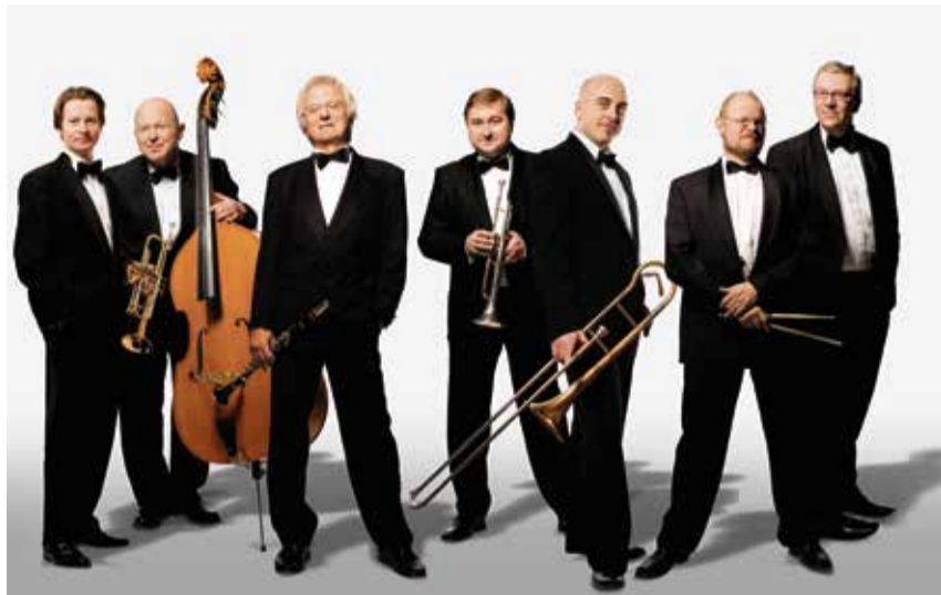
Diese sieben Herren sind eine überzeugende kleine Bigband.

Die Allotria Jazzband spielt besten Old Time Jazz