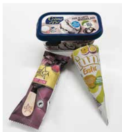
Drei neue Sorten kamen diese Saison in die Regale.

Zu einem Besuch in der Glaceproduktion gehört natürlich auch eine Verkostung. Da boten sich besonders die in diesem Jahr neu in die Regale gekommenen Sorten «MegaStar mini Berry Dark», «FUN Exotic Cornet» und «Crème d'Or Fior di Latte Nocciolata» an. Bewusster Konsum und Ausgewogenheit sind Themen, die bei der Produktentwicklung immer mehr an Bedeutung gewinnen. Auch aus diesem Grund wird das «MegaStar mini Berry Dark» in einer kleineren Portionsgrösse angeboten. Das Schokoladenglace mit fruchtiger Waldbeersauce, umhüllt von knackiger dunkler Schokolade mit knusprigen Himbeerstücken ist ein echter Genuss. Das «FUN Exotic Cornet» derweil ist eine Ergänzung zum schon bestehenden Exotic-Stängel-Glace. Das Rahmglace mit Passionsfruchtsauce wird kombiniert mit einem erfrischenden Passionsfrucht-Mango-Ananas-Sorbet und in einer knusprigen Waffel serviert. Die neueste Crème-d'Or-Sorte vereint Fior-di-Latte-Glace mit intensivem Haselnuss-Kakao-Sorbet. Spannende Texturkontraste und überraschende Geschmackskombinationen sorgen für ein ganzheitliches Genusserlebnis. /fho