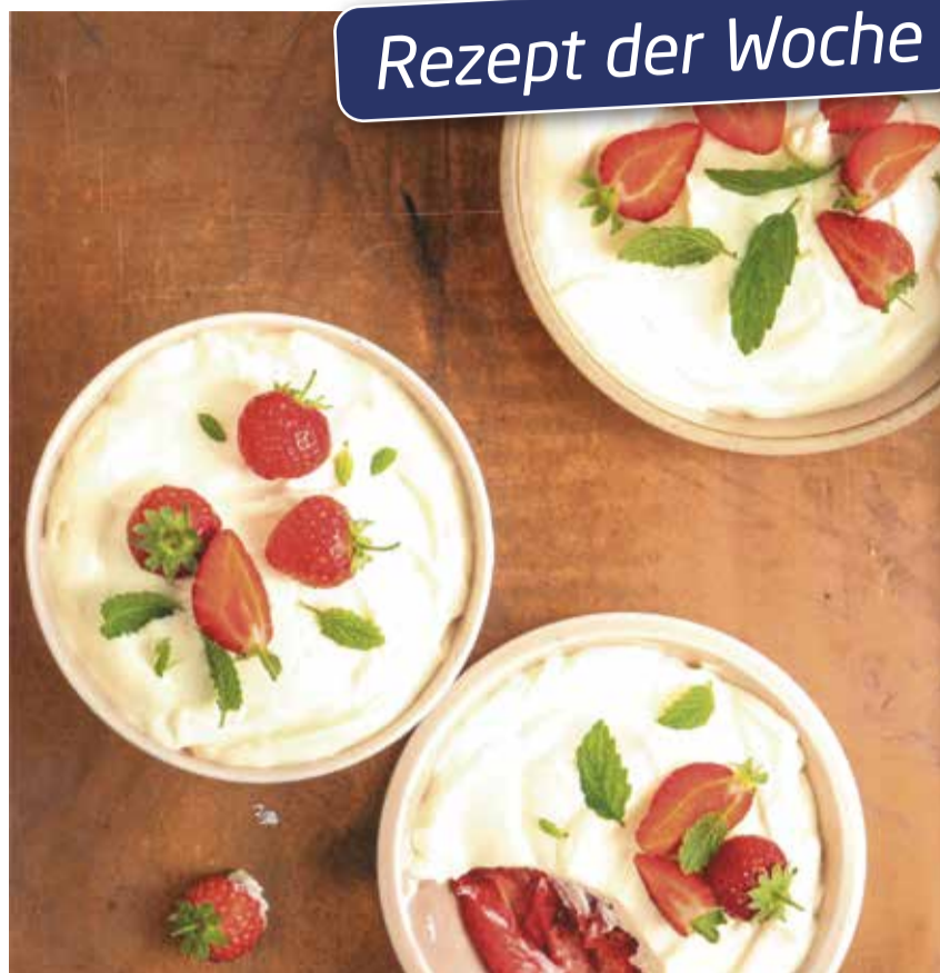
Dieses Tiramisu passt auch für Kinder, denn es enthält Holunderblütensirup an Stelle von Eierlikör und Kaffee.

Vor dem Servieren mit Kakaopulver bestäuben.