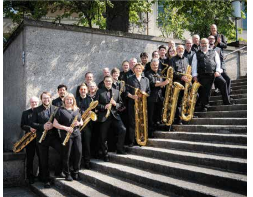
Das Orchester besteht aus Berufsmusikern und versierten Amateuren.

siert der Quartierverein einen Apéro im Park. Bei schlechtem Wetter wird das Konzert in der Aula im Schulhaus Feldmeilen durchgeführt.