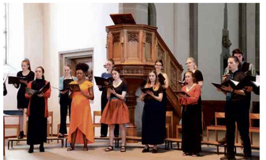
Die jungen Stimmen sind am Sonntagnachmittag in der reformierten Kirche zu hören.

Heute umfasst das Vokalensemble bis zu 40 Stimmen und wird im Oktober 2026 erstmals an einem internationalen Wettbewerb teilnehmen. Diese Wochen stehen daher ganz im Zeichen des Aufbruchs: Die organisatorischen Vorbereitungen für die Wettbewerbsteilnahme sind angefallen und prägen auch die Repertoirewahl für das Sommerkonzert «Bim Moonschyn».