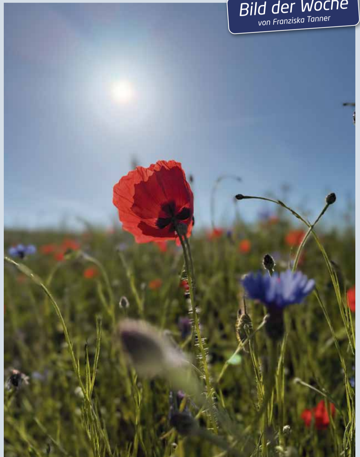
Sonne, Kornblumen und Mohn: Jetzt ist der Sommer wirklich angekommen. Das findet auch Franziska Tanner, die dieses schöne Bild aufgenommen hat.

Wir veröffentlichen jeden Freitag das «Bild der Woche». Senden Sie uns Ihre Schnappschüsse in möglichst hoher Auflösung, zusammen mit ein paar Angaben zum Motiv und Ihrer Adresse, an info@meileneranzeiger.ch . Einsendeschluss ist jeweils Montag, 14.00 Uhr. Jedes veröffentlichte Foto wird mit 20 Franken belohnt.