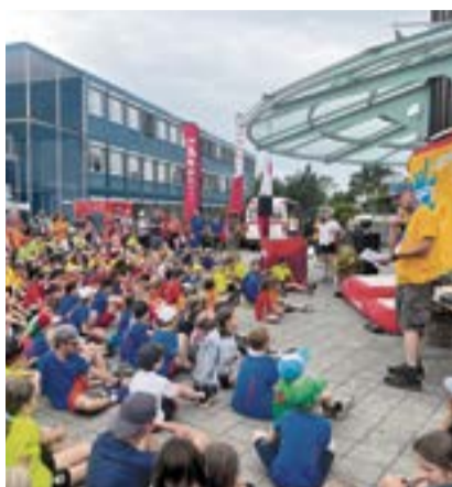
Die Challenge findet an acht unterschiedlichen Orten in der Schweiz statt.

Die Swiss-Ski Summer Challenge geht in die nächste Runde und bietet Vierer-Teams die Möglichkeit, sich spielerisch miteinander zu messen – auch in Meilen.