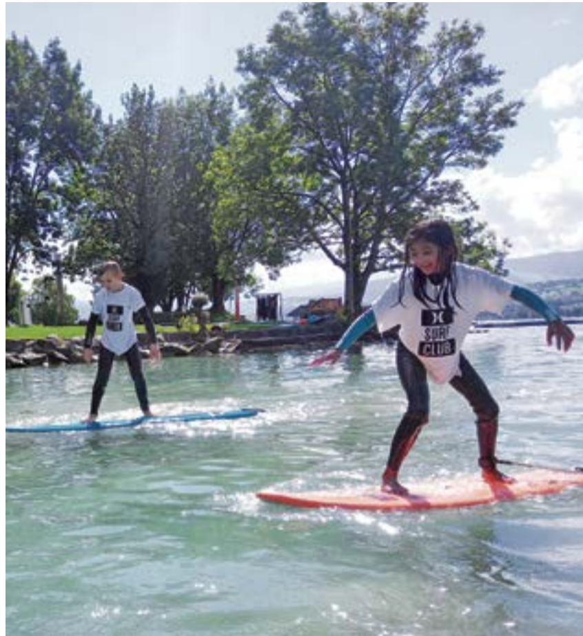
Wer gut schwimmen kann, kann beim Strandbad Meilen auch gut surfen lernen.