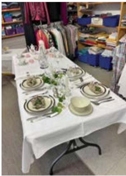
Für die Kaffeerunde und für den Znacht: In der Brocki gibt es schönes Vintage-Geschirr.