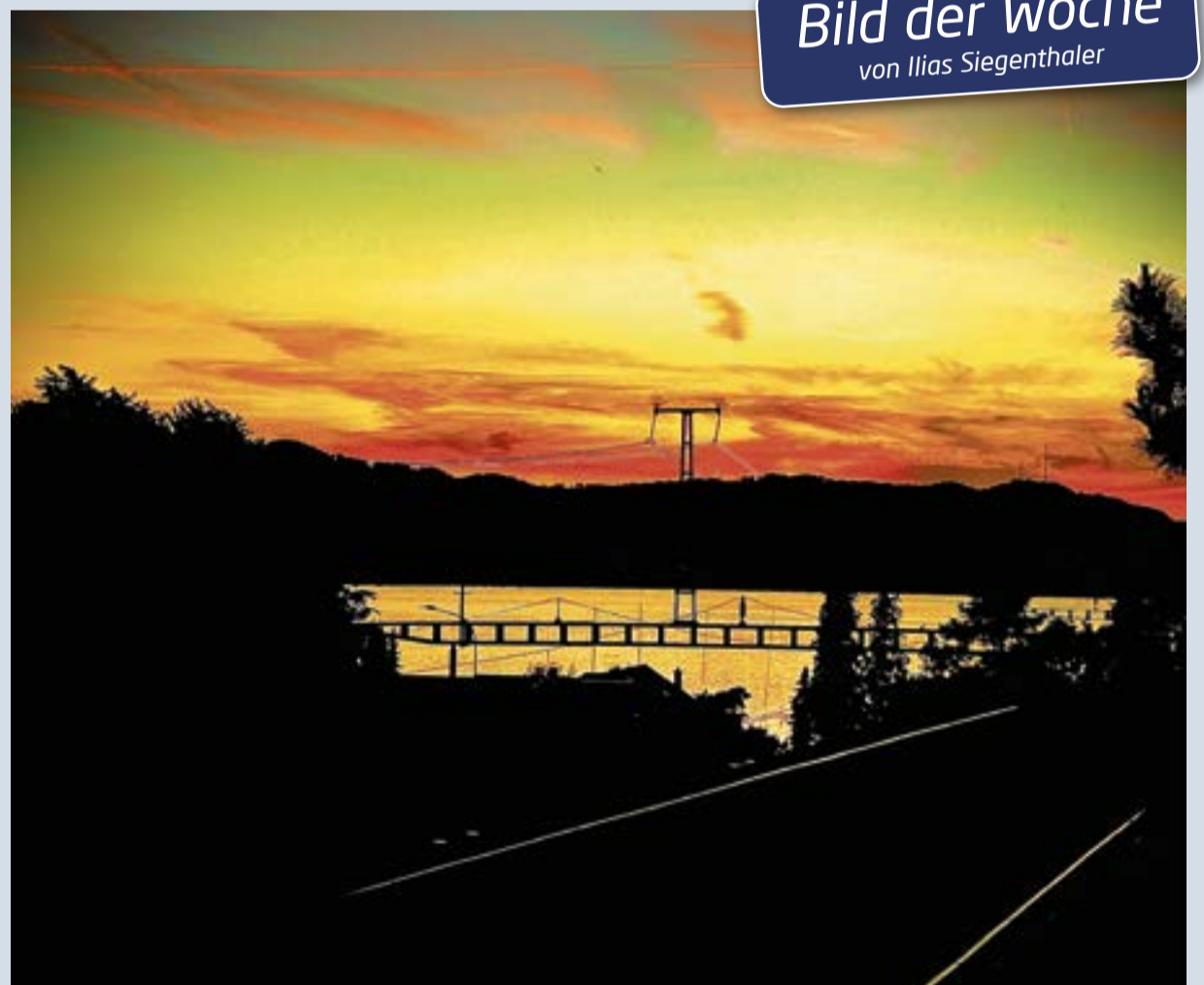
Bild der Woche