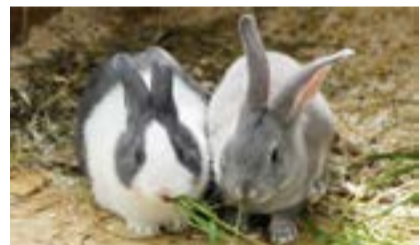
Die flauschigen Kaninchen sind die Stars der Kleintierschau.