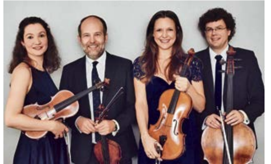
Das Amaryllis Quartett gehört seit vielen Jahren zu den interessantesten Streichquartetten seiner Generation.

Beethovens Streichquartett in e-Moll entstand 1806 und ist dem russischen Grafen Rasumowsky gewidmet, daher der Beiname. Es gehört zu den grossartigsten Streichquartetten, die je geschrieben wurden und gleicht einer Sinfonie für Streichquartett. Das Streichquintett in c-Moll von Mozart ist ebenfalls ein Geniestreich des Komponisten und entstand 1787. Passend zum Thema der Saison – «unerhört» – tritt im Sommerkonzert ein Streichquartett auf, das bisher in Meilen noch nie zu hören war, nämlich das berühmte Amaryllis Quartett. Sein Spiel wird als packend, ausdrucksvoll und vielschichtig beschrieben. Im Streichquintett gesellt