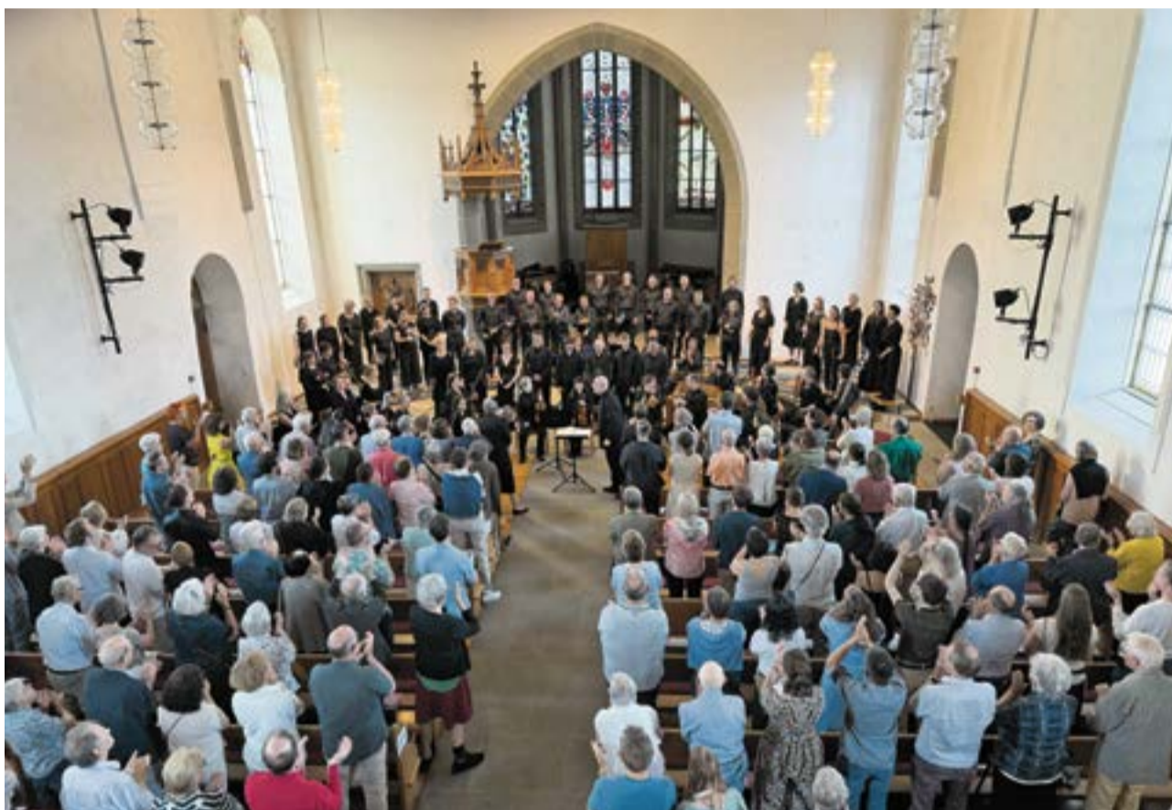
Das Publikum in der reformierten Kirche war vom Dargebotenen begeistert.

Schon die Aufführungsdauer von rund zwei Stunden weist darauf hin, dass dieses Werk nicht für einen gottesdienstlichen Anlass geschrieben worden ist. Auch in anderer Hinsicht ist die h-Moll-Messe eher «unpraktisch» veranlagt. So singt der Chor über weite Strecken fünfstimmig, gelegentlich aber auch vierstimmig. Dann aber auch mal sechs-, ja sogar achtstimmig, also doppelchörig. Spätestens dann muss der Chor sich anders aufstellen. Und das Jagdhorn hat in den ganzen zwei Stunden einen einzigen Einsatz für rund fünf Minuten. Kurz: Das alles sind Hinweise darauf, dass dieses Werk nicht auf einen bestimmten Anlass mit einem bestimmten Chor und Orchester hin geschrieben wurde, sondern eine Art Zusammenfassung von Bachs künstlerischem Lebenswerk darstellt. Für jeden Chor ist das Werk nur schon in gesangstechnischer Hin-