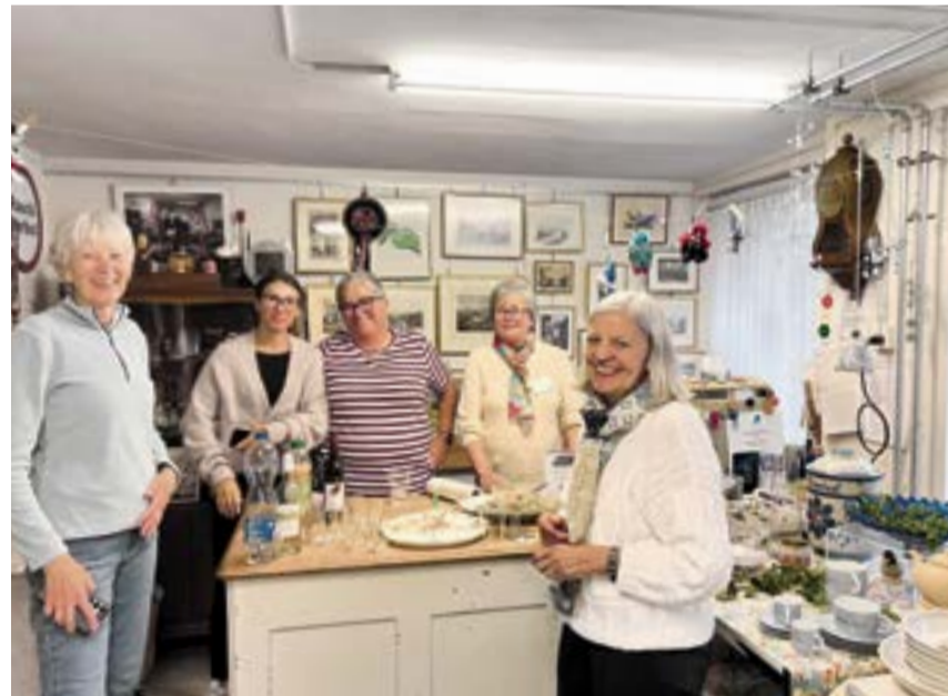
Das Brocki-Team hilft gerne bei der Auswahl.