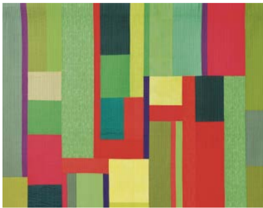
Dieses Werk trägt den Namen «Winds of Change», 143x149 cm.

Sie fühlt sich privilegiert, etwas machen zu dürfen, was sie erfüllt und möchte etwas von der Freude, die sie beim Entwerfen und Gestalten ihrer Bilder erlebt, weitergeben. Die Textilkunst ist ihr Medium, um ihren Ideen eine Form zu geben und sich auszudrücken. Das Experimentieren mit