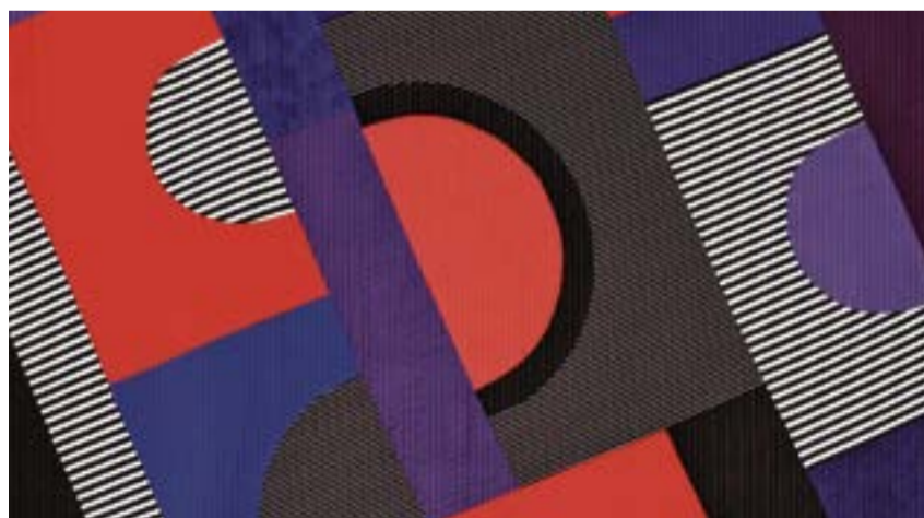
Michèle Samter: «Hommage à Sonia», 151x148 cm.