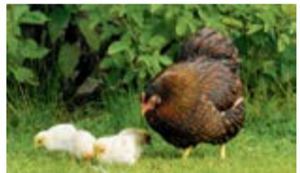
Hühner mit ihren Küken sind immer besonders «jöööh».