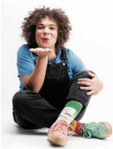
Erstmals am Festival dabei: Tante Carmen nimmt Kinder mit auf fantasievolle Reisen.

Über 25 Food-Anbieter aus aller Herren Länder machen den zentralen Dorfplatz zum kulinarischen Basar der Extraklasse. Die Food-Scouts des OK-Teams haben wieder ganze Arbeit geleistet und an diversen Festivals neue Talente aufgegebelt – quasi die Streetfood-Version von «Germany's Next Top Burger». Wer sich eine Übersicht über die Neulinge verschaffen will, findet die verschiedenen Food-Artisten auf der Facebook-Seite des Festivals. Ob feurige asiatische Woks, sündhaft gute Burger, vegane Verführer oder Schweizer Klassiker mit rebellischem Twist: Hier findet sogar der wählerischste Gaumen sein neues Lieblingsgericht. Und das Motto «come