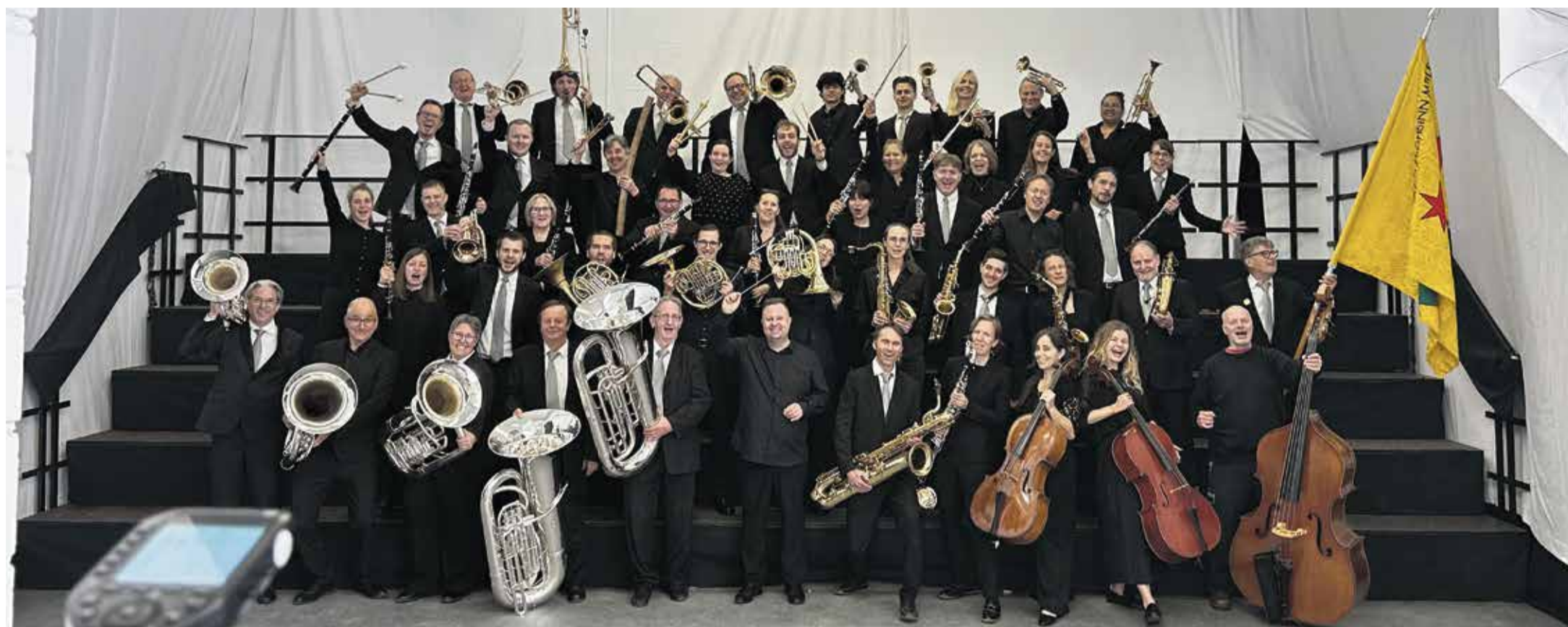
Die Musikerinnen und Musiker des MVM erlebten ein unvergessliches Fest in Biel.

Grosser Erfolg am Eidgenössischen Musikfest