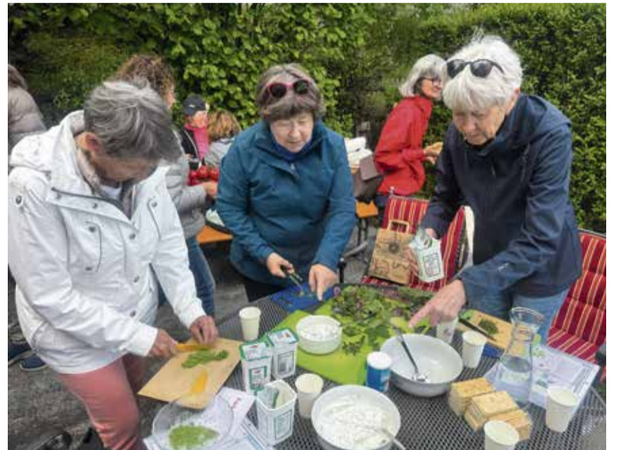
Gemeinsam wurden die gesammelten Wildkräuter verarbeitet. Hier entstanden unterschiedliche Kräuter-Dips.

rauke, Taubnessel, Rapunzel (falscher Spargel), Waldmeister oder Weissdorn. Alles direkt vor der eigenen Haustüre! Beim Sammeln von Wildkräutern und Pflanzen gilt, man nimmt nie den ganzen Bestand von einem Standort, damit sich die Natur regenerieren kann, lässt andere Sammlern etwas übrig und geht ganz grundsätzlich vorsichtig mit der Natur um. Wer Heilpflanzen sammelt, tut dies optimalerweise am Morgen, weil die Heilkraft dann stärker ist. Der Frühling eignet sich gut zum Sam-