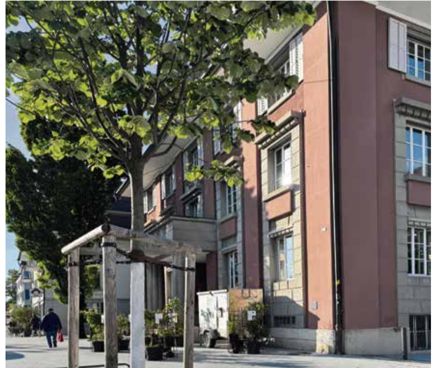
Die weisse Farbe schützt die Baumstämme vor starker Sonneneinstrahlung und Hitze.

Die Verantwortlichen der Gemeinde Meilen haben sich daher für eine alternative Technik entschieden: den Stammanstrich. Der Vorteil eines weissen Stammanstrichs besteht darin, dass sich der Baumstamm während des Abwitterungsprozesses, der bis zu fünf