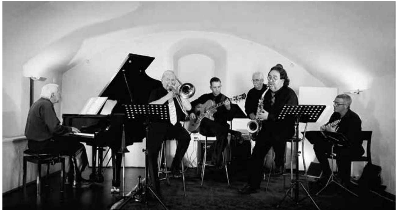
Der Sound des LaMarotte Swingtetts ist geprägt von der Rhythm Section à la Count Basie.

Der Sound des LaMarotte Swingtetts ist geprägt von der Rhythm Section à la Count Basie. Der Solo-Gitarrist begeistert mit seiner Fingerfertigkeit und seinen Riffs, während die beiden erfahrenen Frontbläser für raffinierte Tutti, mitreissende Impros und hu-