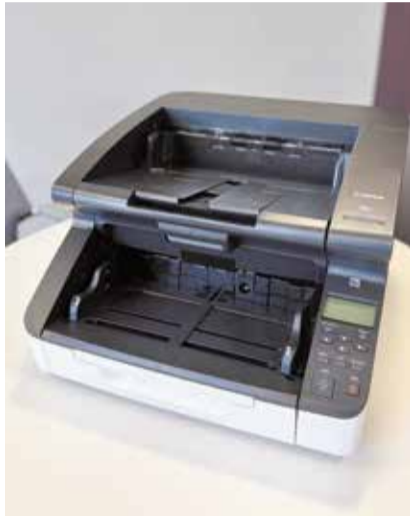
Diese Maschine zählt supergenau.

Das E-Counting-System umfasst einen Scanner mit integriertem Imprinter zur automatischen Nummerierung der Stimmzettel sowie eine lokale Auswertungssoftware. Der Kanton stellt für alle Vorlagen eines Urnengangs einen einheitlichen maschinenlesbaren