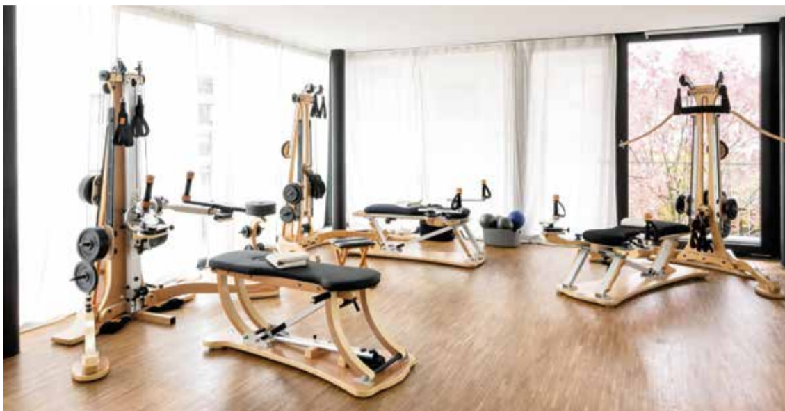
Im Studio ist seit Anfang Mai mehr Platz verfügbar.

Das Training, das Germaine Lauterburg anbietet, heisst «GYROTONIC® und GYROKINESIS®». Es setzt auf dreidimensionale, ineinanderfließende Bewegungen. «Die Übungen verbinden Atmung, Beweglichkeit und Kraft», erklärt sie. Statt einzelne Muskeln isoliert zu trainieren, arbeitet der Körper als Einheit. «Es geht darum, den Kör-