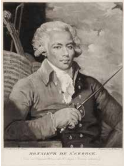
Joseph Bologne, Chevalier de Saint-George wurde auch als «Voltaire der Musik» bezeichnet.

Glücklicherweise wurde er im Jahr 2002 rehabilitiert. Heute trägt eine Strasse im 1. Arrondissement von Paris seinen Namen: die Rue du Chevalier de Saint-George. Joseph Bologne de Saint-George hinterliess ein musikalisches Werk von unschätzbarem Wert. Seine Violinkonzerte voller Eleganz und Anmut werden weltweit aufgeführt. «Das ist Mozart – mit einer zusätzlichen Note von Melancholie».