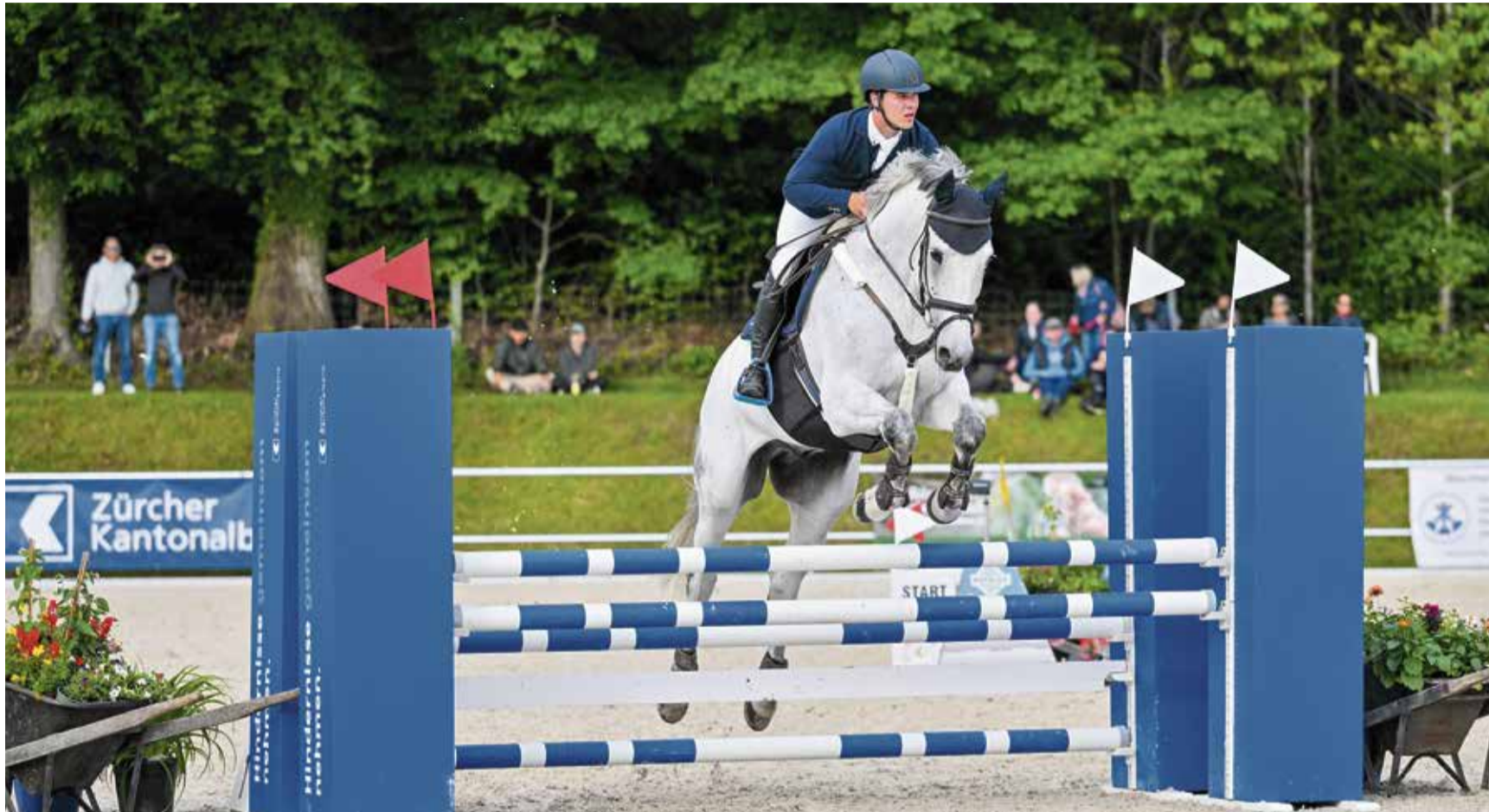
Auch dieses Jahr wird auf dem Pfannenstiel Pferdesport auf höchstem Niveau geboten.

Springkonkurrenz Pfannenstiel am übernächsten Wochenende