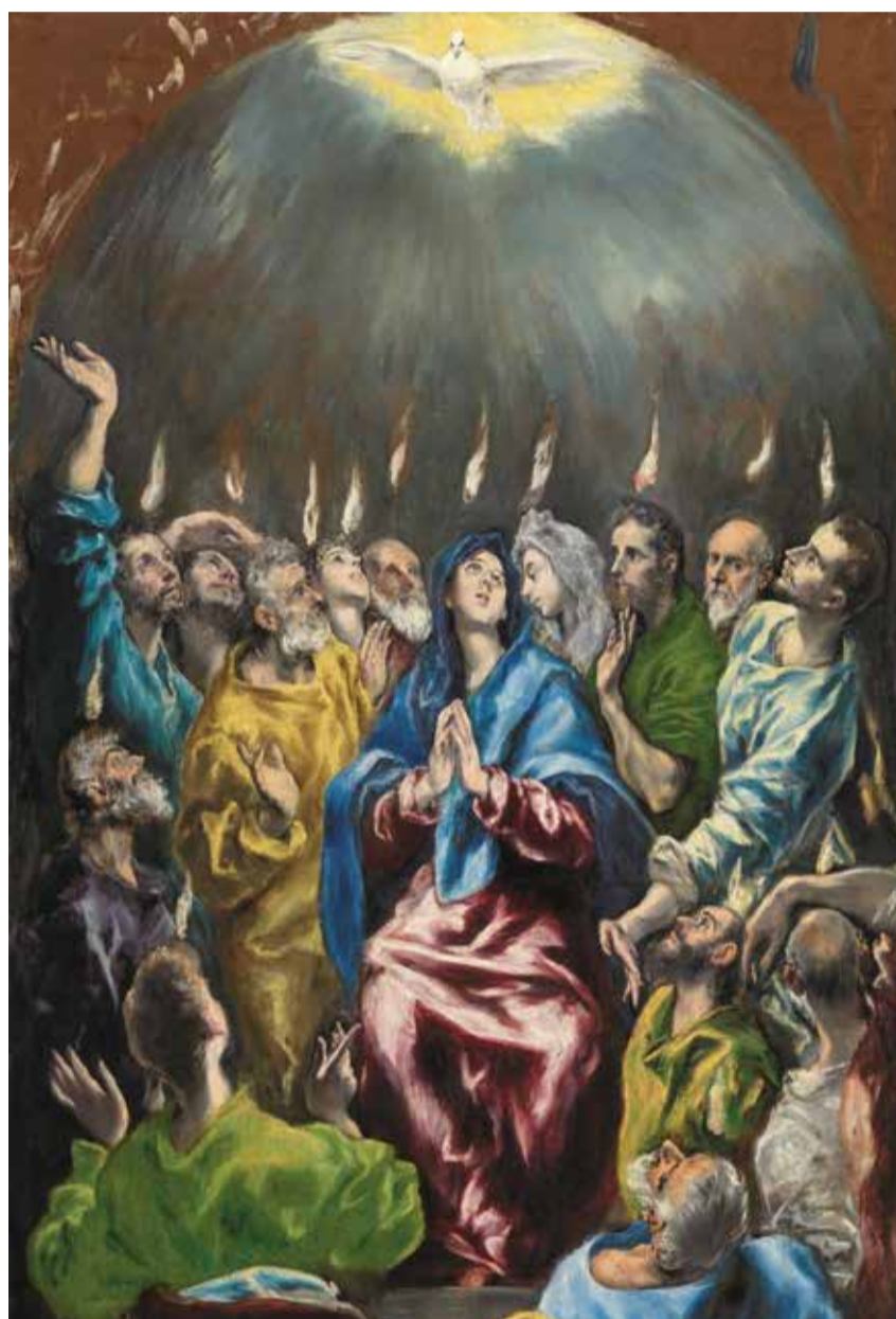
El Greco, Pentecostés, um 1600 (Ausschnitt).

Die Bibel kennt dazu noch eine andere Geschichte, ohne die Pfingsten kaum verständlich wird: den Turm-