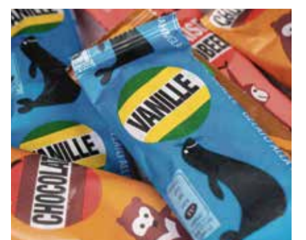
Die beliebten Stängelglacés der Migros werden in Meilen hergestellt.