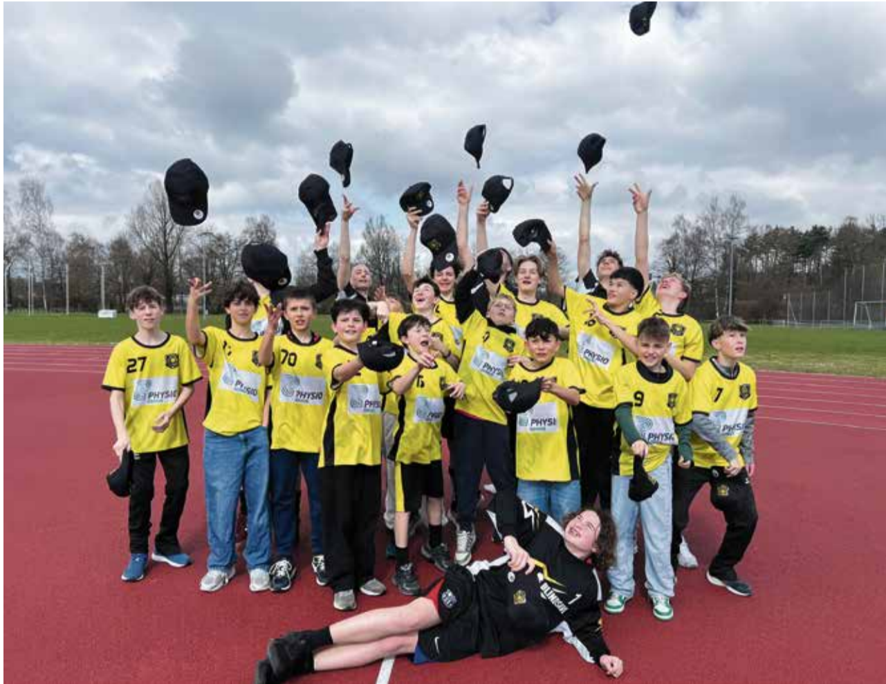
Sie holten in 17 Meisterschaftsspielen 15 Siege: Die U14-Junioren der Lions Meilen Uetikon.