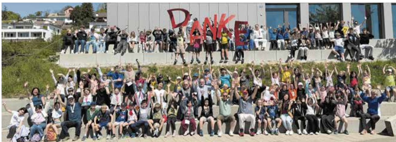
Gruppenbild am Ende einer spielerisch-sportlichen Woche: Die Kinder, Trainingsleiter, Helfer und Organisatoren verabschieden sich.

Jedes Kind wählte aus den zehn Angeboten drei aus, auf die es besonders «gluschtig» oder neugierig war. Ein motiviertes und engagiertes Team von rund zwei Dutzend qualifizierten Trainingsleiterinnen und -leitern ermöglichte den Kids dann pro Disziplin drei Halbtage lang neue Erfahrungen und Erlebnisse in der Gruppe. Klassische Sportarten wie Fussball,