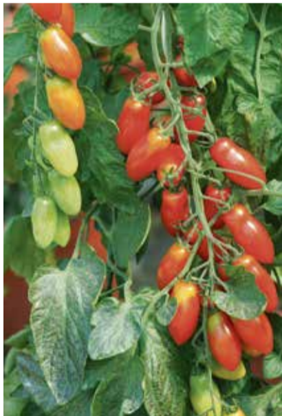
Pflaumtomaten sind besonders attraktiv für einen Apéro oder den kleinen Hunger zwischendurch.