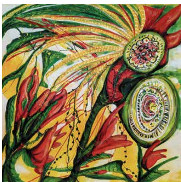
Farben sind Ursula Boos wichtig.