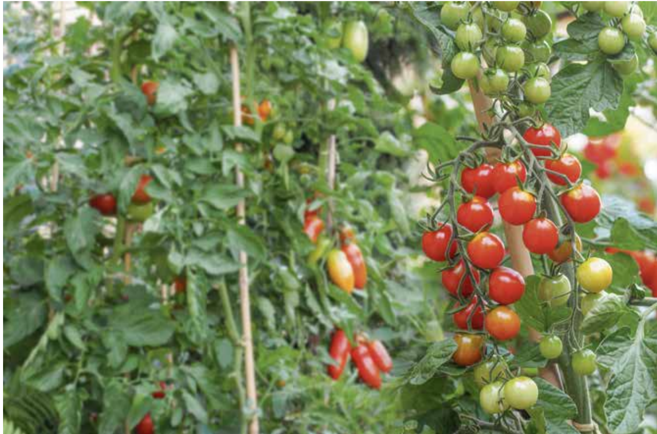
Bereits ist eine ganze Palette von resistenten Tomatensorten erhältlich, von der Cocktailtomate bis zum länglichen Mini-San-Marzano-Typ.

Resistente Sorten gedeihen ohne viel Pflege