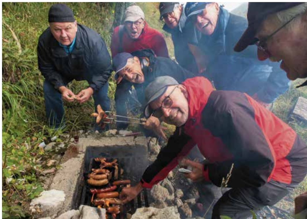
Beim MTV geht's nicht nur ums wöchentliche Turnen, sondern auch um Geselligkeit: Hier beim «Bräteln» anlässlich der Turnfahrt auf den Weissenstein 2024.