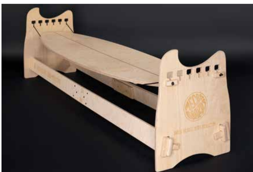
Entwickelt in Meilen, angefertigt in der Schweiz: Der neue Balance Trainer Pro.

In der Schweiz wächst die Szene rund um Surfen und boardsportnahe Bewe-