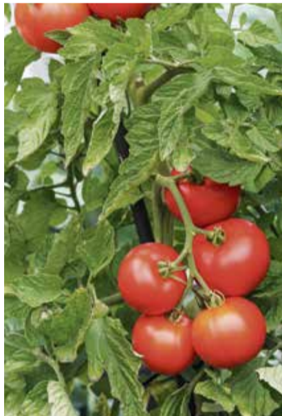
Tomaten aus dem eigenen Garten überzeugen mit Geschmack und Farbe.