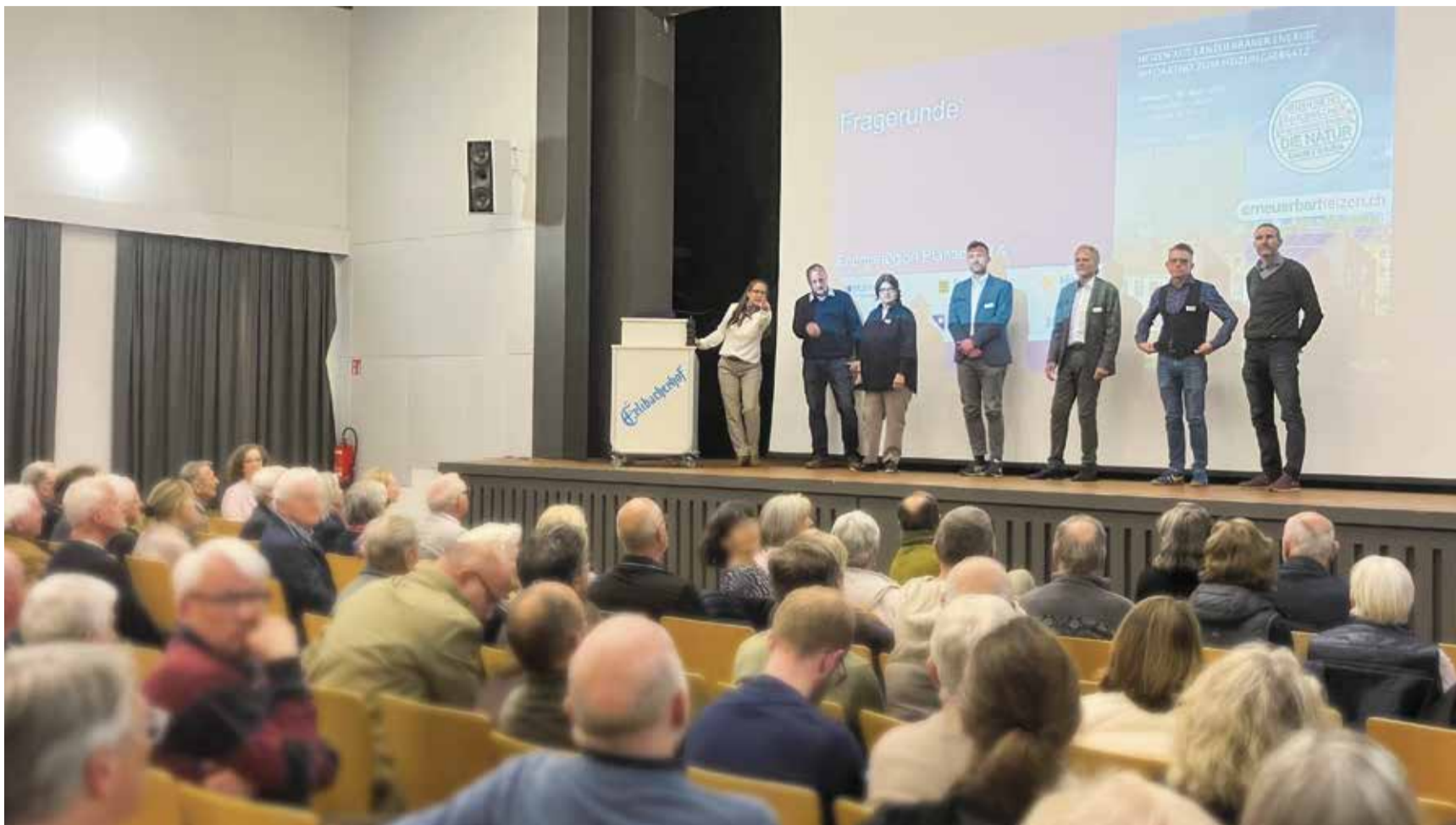
Umweltfreundlich heizen: Der Informationsabend in Erlenbach war gut besucht.

Als Teil der Energieregion Pfannenstil hat sich die Gemeinde Meilen für die gelungenen Anlässe engagiert. Dort wurde auch darüber informiert, dass Meilen, der Kanton und der Bund den Wandel mit Energieberatungen unterstützen und dass Förderungen existieren. Ferner war zu erfahren, dass sich eine neue Heizung nicht isoliert betrachten lässt. Vor dem Einbau sollte die Gebäudehülle auf Wärme-