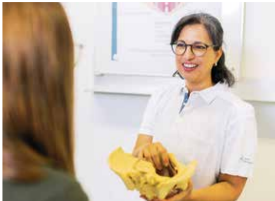
Ein interdisziplinäres Team behandelt die Beckenbodenbeschwerden.

Die breite fachliche Verankerung zeigt, was Beckenbodenbeschwerden so komplex macht: Oft sind verschiedene Organsysteme gleichzeitig betroffen, und das Beschwerdeprofil reicht von Harnrang und Harninkontinenz über Stuhlinkontinenz bis hin zur Senkung