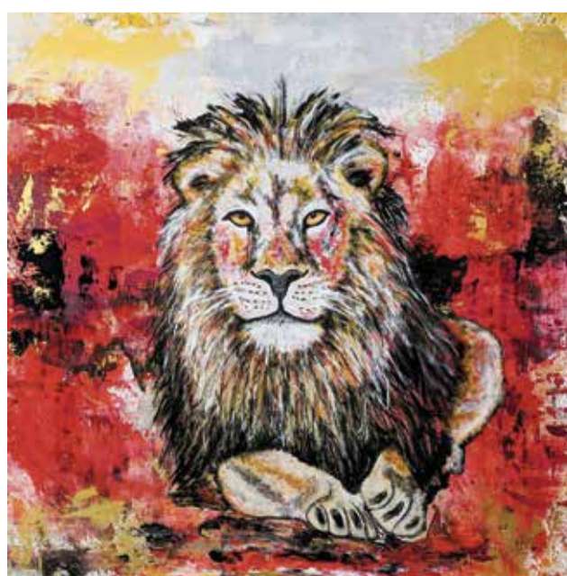
Ein Portrait aus der Welt der Wildtiere.