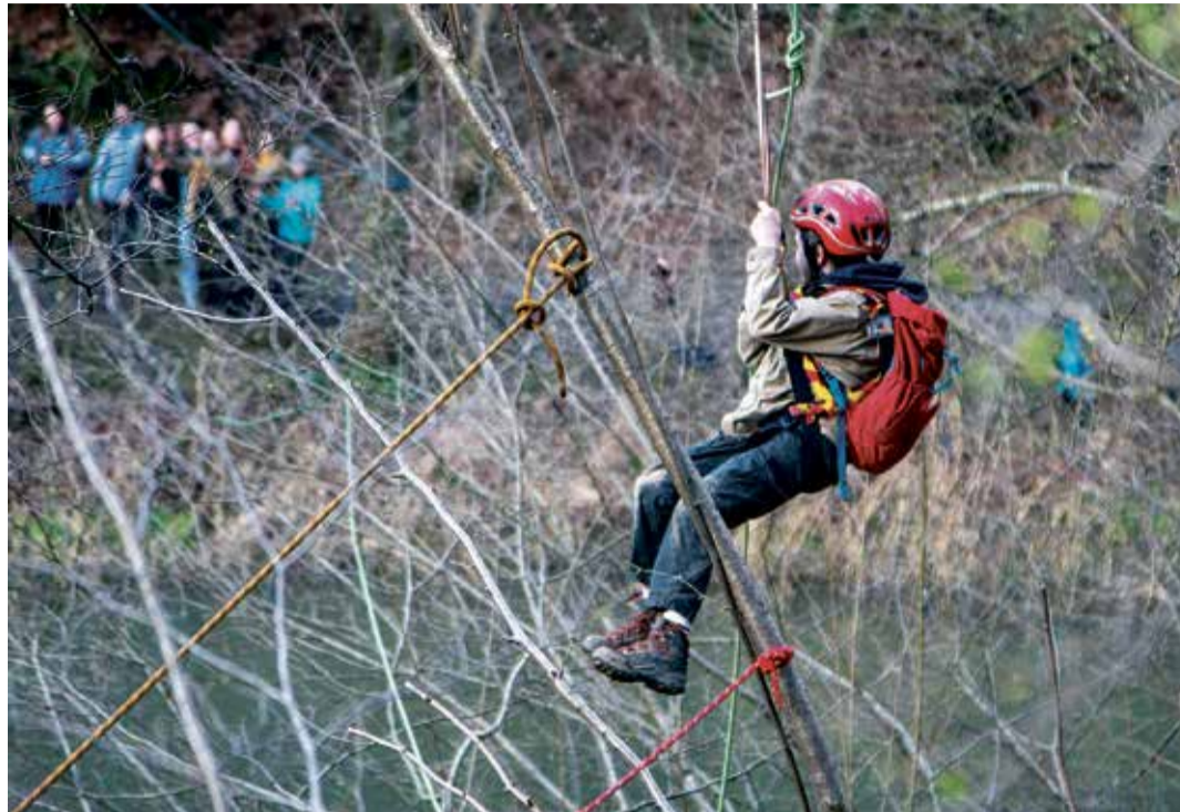
Das «Übereschüttle» ist ein grosses Highlight für alle Pfadis: Hier ist ein Wölfli auf dem Weg zu seiner neuen Pfadigruppe.

Die Abwechslung, die die Pfadi bietet, sei für sie dabei der grösste Reiz: Die Pfadis verbringen den Samstagnachmittag in altersgerechten Stufen im Wald, wo die Leiterinnen und Leiter jede Woche ein spannendes Programm zusammen-