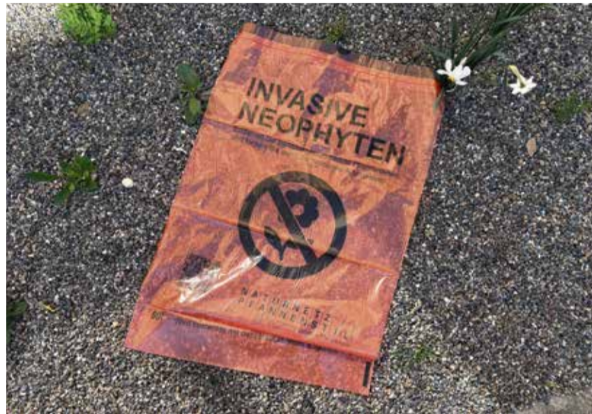
Der Neophytensack kann gratis bei der Gemeinde bezogen werden.

Mit dem Neophytensack gegen invasive Pflanzen