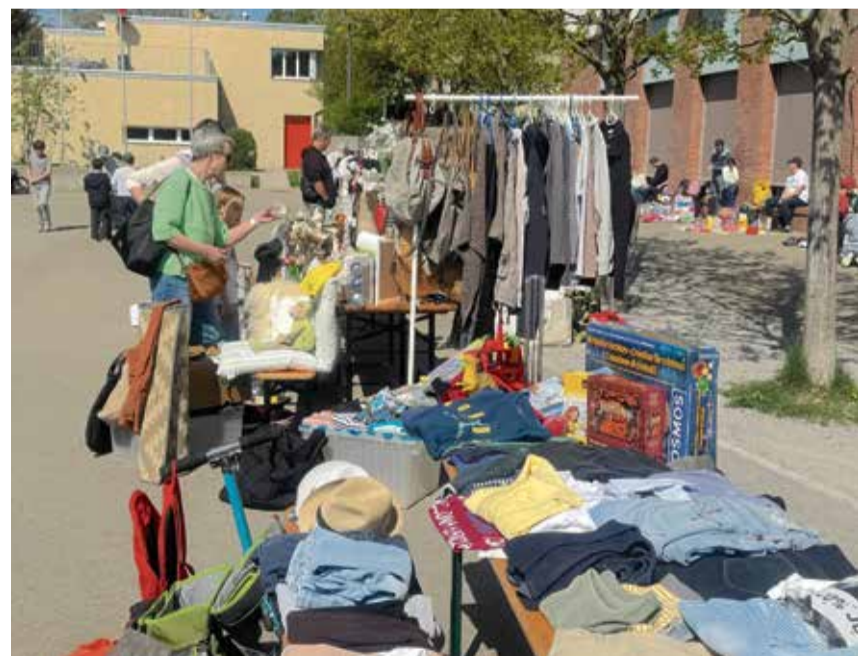
Secondhand-Kleidung trifft auf gut erhaltene Nippes und Spielsachen.