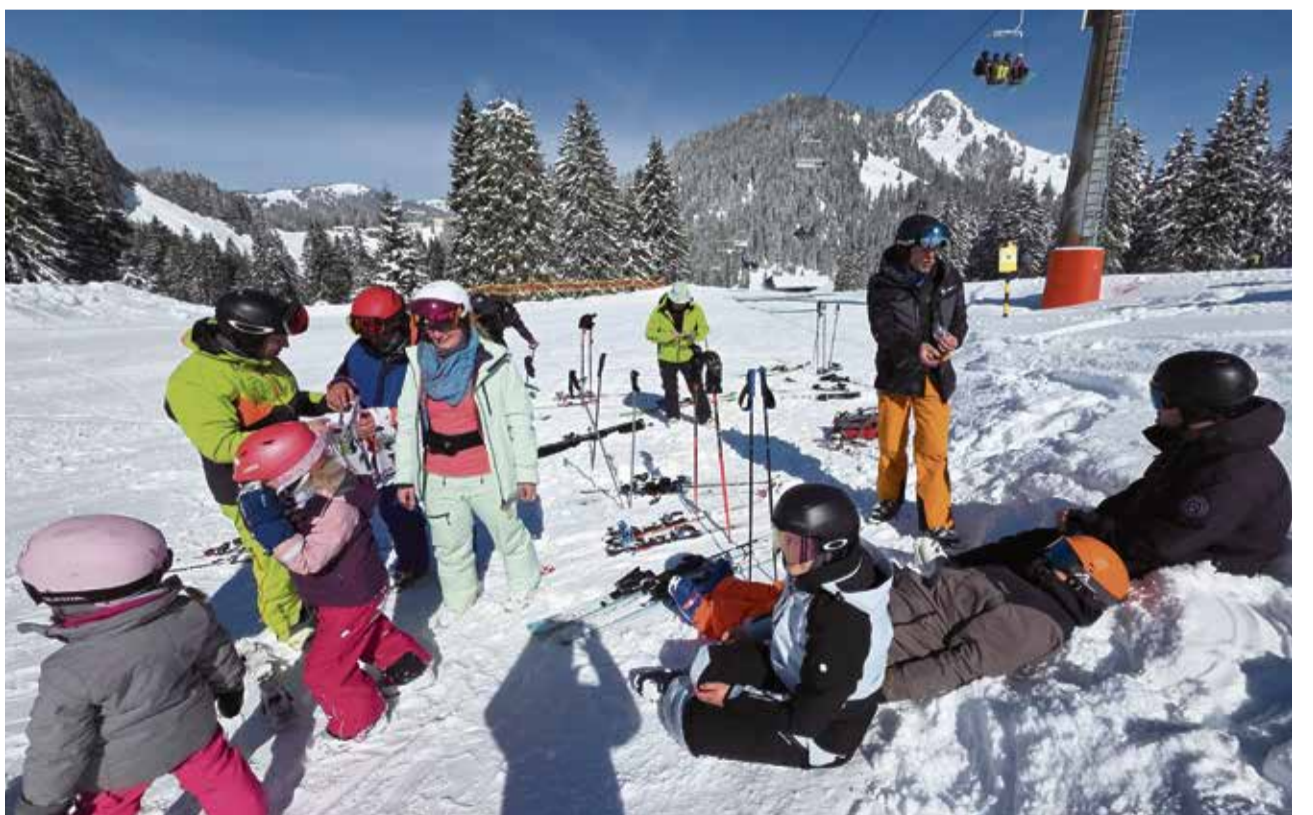
Kurze Pause bei schönste Wetter am Ziel.

Nach dem Rennen traf man sich zum Mittagessen, bevor es am Nachmittag nochmals auf die Piste ging. Ein besonderes Highlight war die unerwartete Begegnung mit der Skirennfahrerin