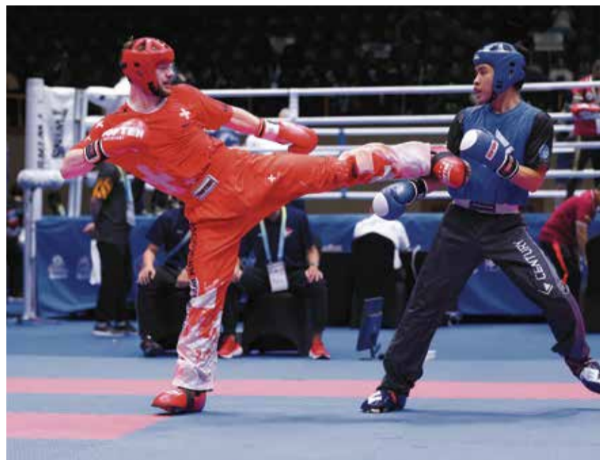
Kickboxer Dylan Hauser steht aktuell in der Weltrangliste auf Rang 4.