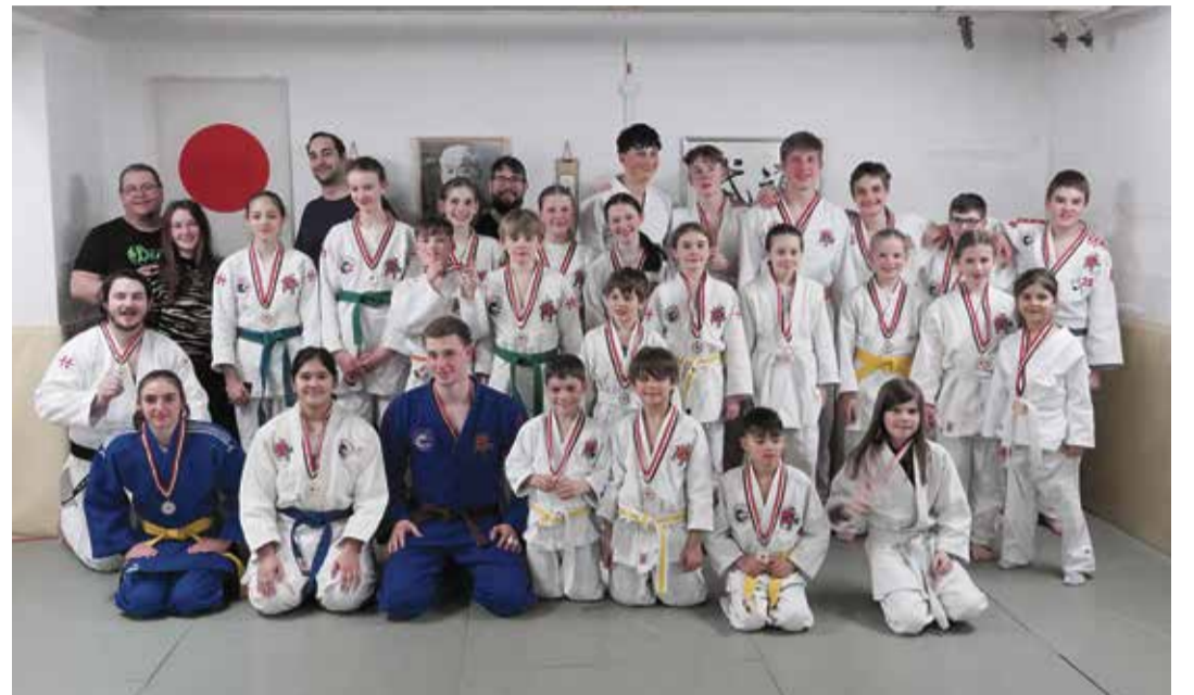
Das Judo-Team Meilen.