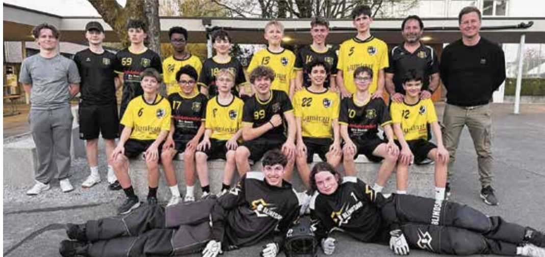
Gespannt, was die nächste Saison bringt: Die U16 der Meilemer Lions.