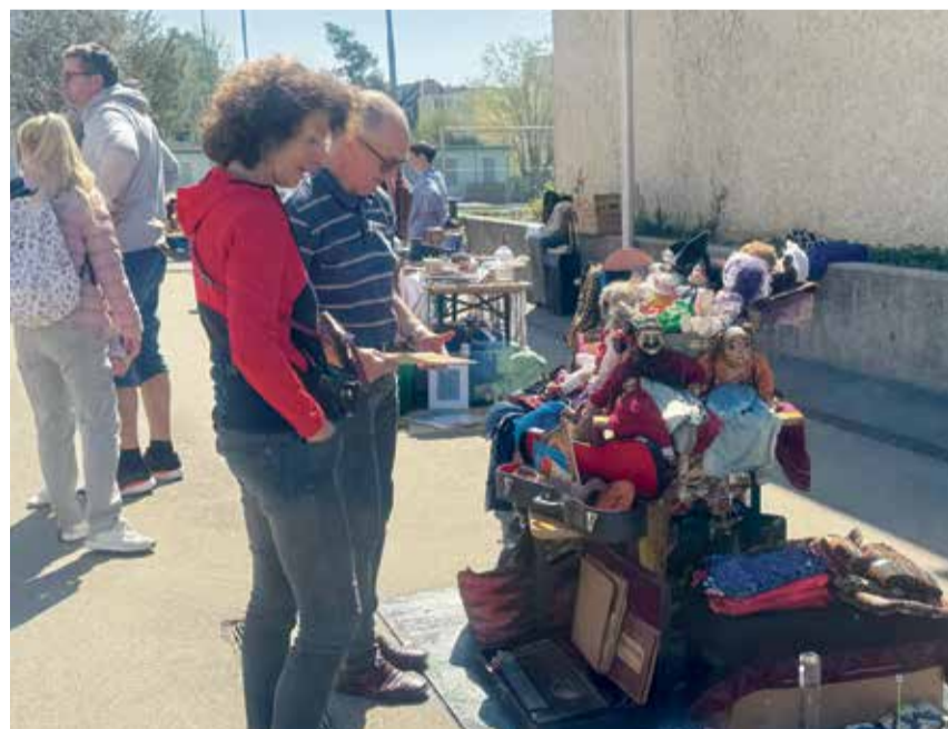
Hier wird wohl eine kleine Puppensammlung aufgelöst.

Auch die 3. Ausgabe fand bei bestem Wetter statt