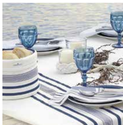
Ein schön gedeckter Tisch macht jeden Apéro besonders

Man darf sich freuen auf die gemütliche Atmosphäre mit liebevoller Dekoration. Zu entdecken gibt es eine grosse Auswahl an schönem Geschirr und praktischen Kochutensilien.