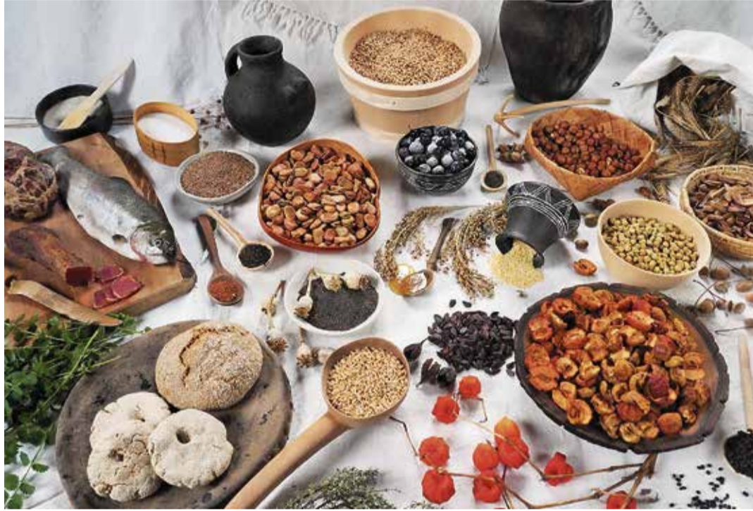
Was haben die Pfahlbauer vor mehreren Tausend Jahren gegessen?