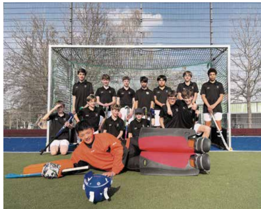
Die U15 ZüriBoys in Buchlern gegen BBHC.

Für die Jungs startete die Rückrunde mit machbaren Gegnern. Beides Tabellenachtern. Entsprechend eng und hart umkämpft waren die Par-