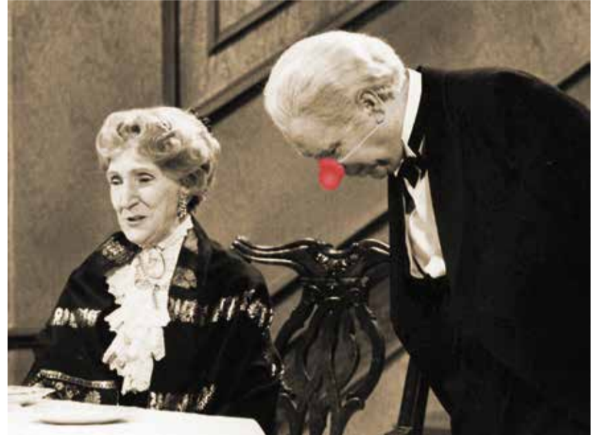
Die Vorbilder des Festmahls im Atelier-Theater: Butler James und Miss Sophie aus «Dinner for One».