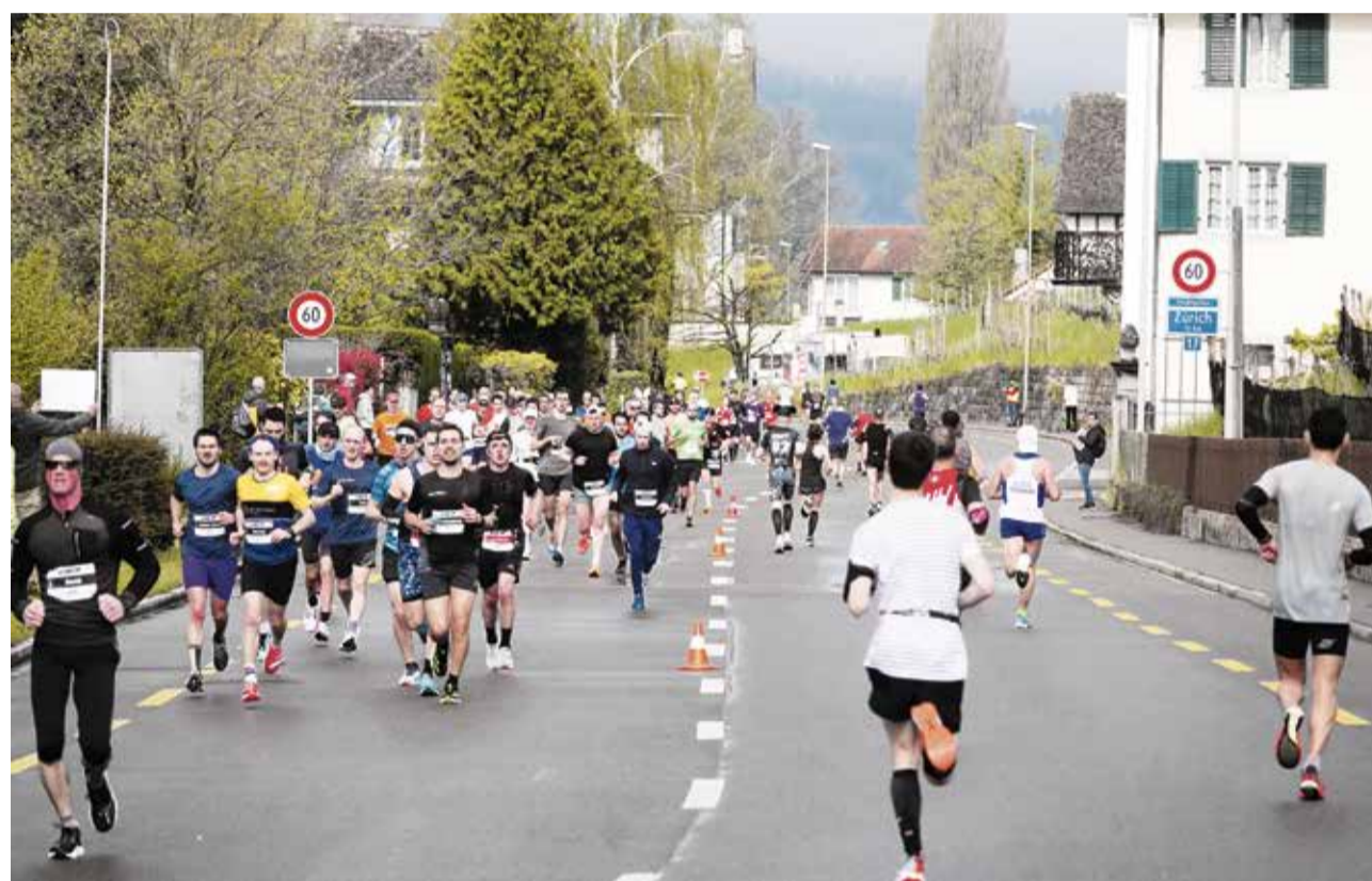
Einmal im Jahr verwandelt sich die Seestrasse in einen Lauftrack.