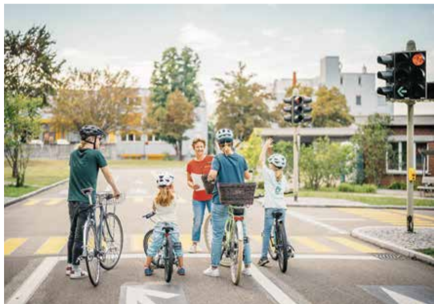
Die Kinder trainieren ihre Geschicklichkeit und die Eltern frischn ihr Wissen über Verkehrsregeln auf.

In Meilen werden am Mittwoch, 6. Mai von 14.00 bis 17.00 Uhr zwei Kursformate angeboten. Kurs A: Sicheres Terrain, ab 6 Jahren. Hier wird die Basis gelegt. Auf dem geschützten Areal auf dem Pausenplatz des Schulhauses