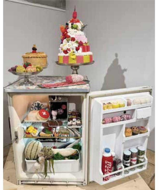
Mit Augenzwinkern «zubereitet»: Die gestrickten Nahrungsmittel von Madame Tricot.

Die Ausstellung ist geöffnet von 14.00–17.00 Uhr.