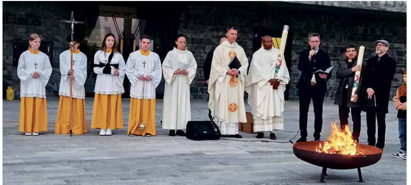
Traditionelles ökumenisches Osterfeuer auf dem Dorfplatz.

Der Karfreitag ist ein Tag des Innehaltens. Auch in einer pluralistischen Gesellschaft behält er seine eigentümliche Stille. In der reformierten Kirche Meilen wird diese Stille liturgisch aufgenommen und vertieft. Pfarrer Erich Wyss predigt zu 2. Korinther 5,14–21 – einem Abschnitt, der von Versöhnung spricht. Im Abendmahl wird diese Versöhnung nicht nur bedacht, sondern gefeiert: Christus gibt sich hin, damit neues Leben möglich wird. Musikalisch wird der Gottesdienst durch das Vokalensemble unter der Leitung von Ernst Buscagne mit Auszügen aus Bachs h-Moll-Messe gestaltet.