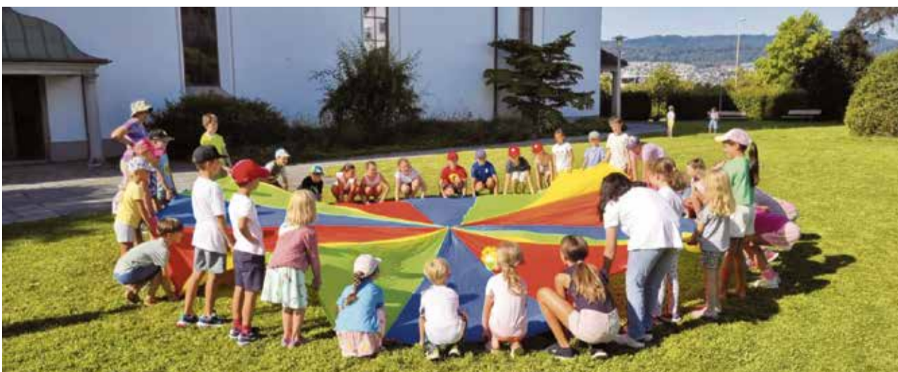
Eine erlebnisreiche Ferienwoche zu Hause in Meilen erleben.