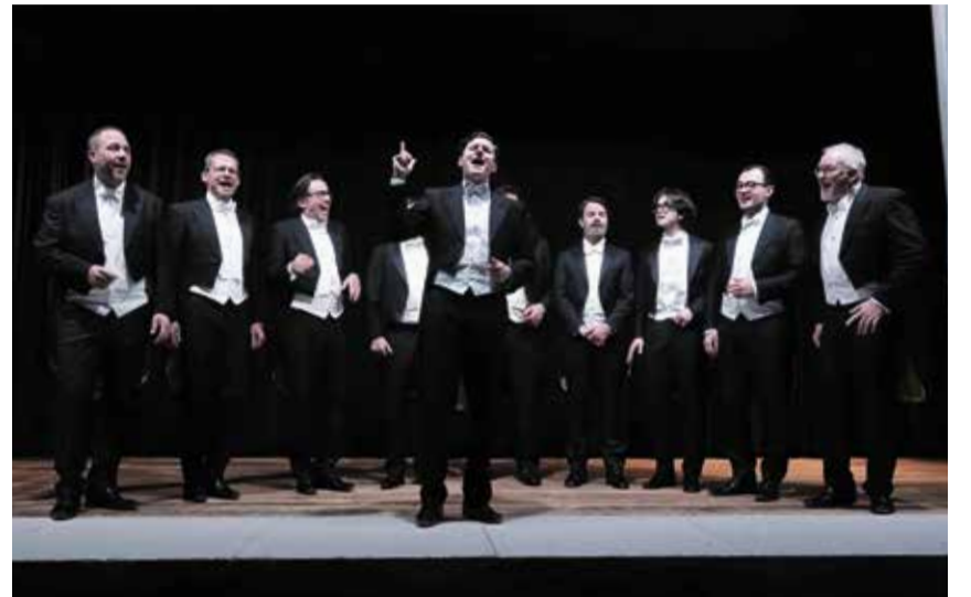
A cappella vom Feinsten aus der Schweiz: Zehn «Pinguine» sangen auf der Löwen-Bühne.

«The Singing Pinguins» an der Mitgliederversammlung