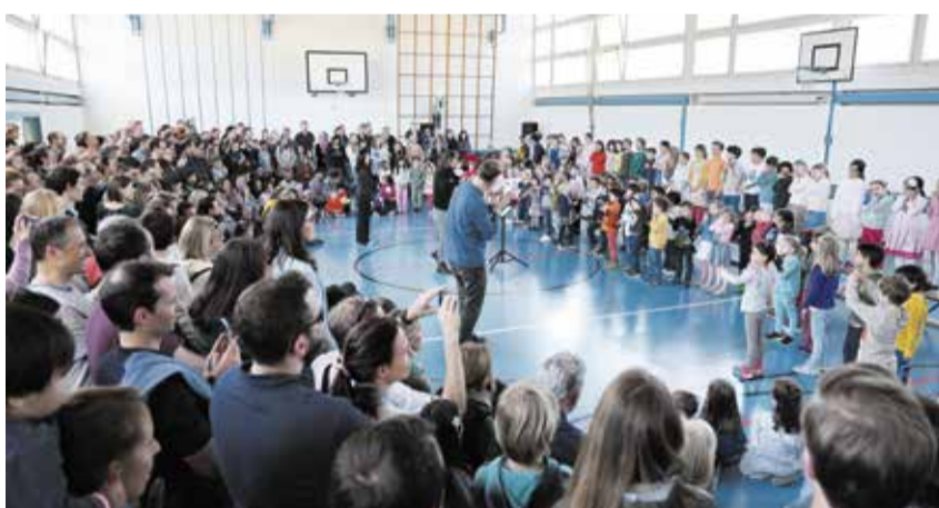
Grosser Andrang beim Eröffnungskonzert des Instrumentenparcours 2025 in Meilen.

Wenn ein Kind erlebt, wie ein Instrument schwingt, klingt oder sich anfühlt, entsteht oft Begeisterung – manchmal ist das der Beginn einer jahrelangen musikalischen Reise.