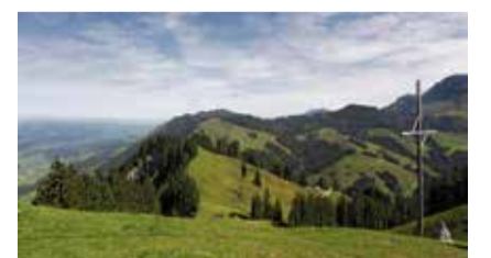
Dieses Mal führt der Ausflug ins schöne Entlebuch.

Die Senioren-Ausflüge werden von der katholischen und der reformierten Kirche organisiert und von der Gemeinde Meilen unterstützt.