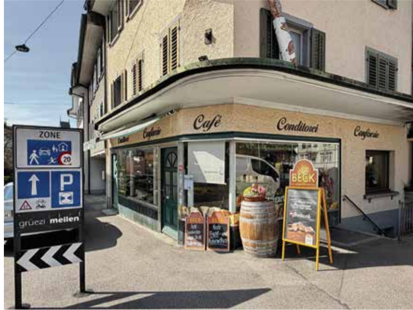
Der Laden an der Kirchgasse 55 umfasst auch ein Café. Die erste Bäckerei wurde hier bereits vor 100 Jahren eröffnet.

Die Bäckerei/Konditorei Brandenberger mit Café prägte mehr als 20 Jahre lang den nördlichen Eingang zur Kirchgasse. Doch bald ist Schluss: Am Samstag, 18. April werden zum letzten Mal im Laden Brote, Kleingebäck und Patisserie verkauft und im zürichseitigen Teil Kaffee und Tee serviert.