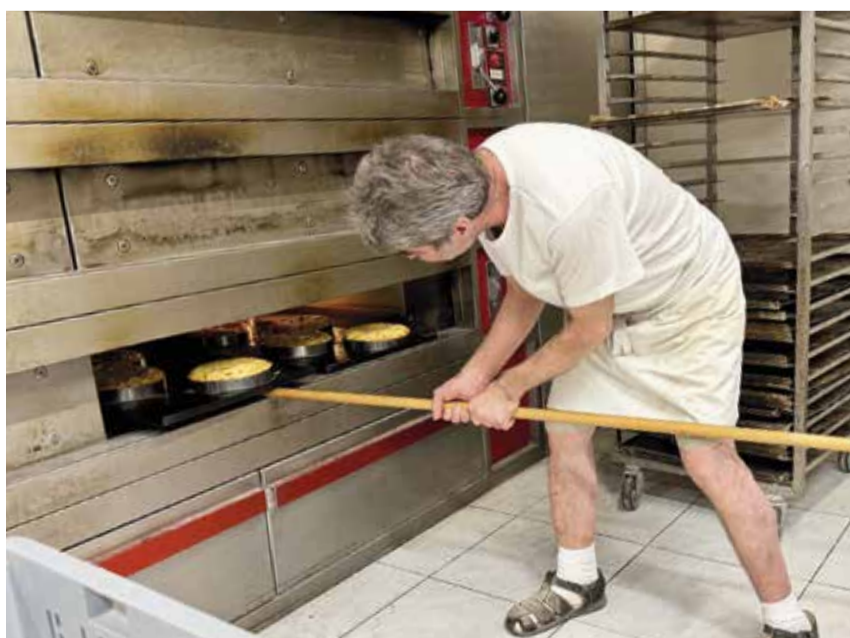
Der Ofen mit vier Etagen verbreitet in der Backstube behagliche Wärme.