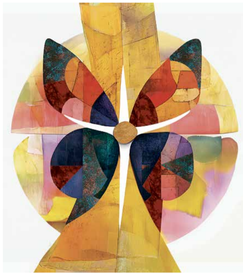
Der Schmetterling ist ein Ostersymbol für das Jahr 2026 von Hongler Kerzen Altstätten, wo seit über 300 Jahren Kerzen für die Kirche produziert werden.

Diese Vorstellung widerspricht der Idee, dass Erlösung verpasst, wer sie nicht schnell, bewusst, mit grosser Anstrengung und Glaubenskraft anstrebt. Sie kann nicht durch einen Kraftakt erzwungen oder gemacht werden. Erlösung bleibt Geschenk. Kein Bereich ist zu tief, keine Vergan-