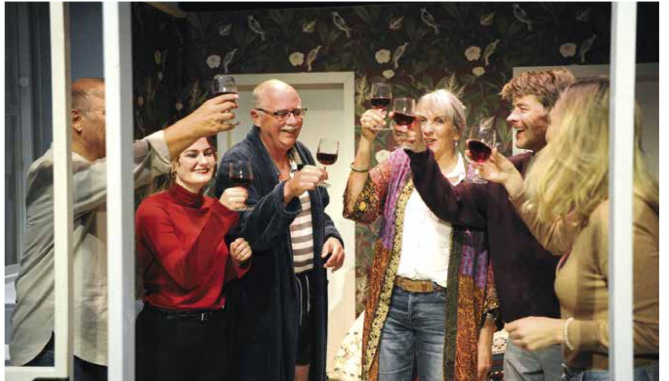
Jung und Alt vereint unter einem Dach. Am Ende kommt es gut, aber davor gilt es einige Schwierigkeiten zu bewältigen.

Doch da haben sie die Rechnung ohne die andere Wohngemeinschaft im Haus gemacht. Diese besteht aus drei Studenten und verfolgt komplett andere Ziele. Lernen und leisten lautet hier das Motto, dem alles untergeordnet wird. Die Konflikte zwischen diesen ungleichen Wohnparteien sind vorprogrammiert, zumal sich das Haus als extrem schalldurchlässig erweist. Worum es bei den Auseinandersetzungen konkret geht und wie sie sich am Schluss auflösen, das sei hier nicht verraten. Nur so viel: Die Umkehrung von Klischees sorgt für viele Lacher, denn die Alten erweisen sich als offen, locker und tolerant, während die Jungen vor allem zu Beginn getrieben, gestresst und abweisend erscheinen. Diese Gegensätze gibt auch das ge-