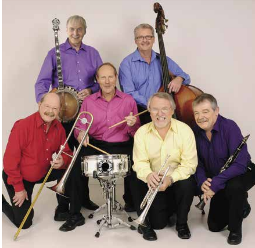
Humorvolle Stimmungsmacher: The New Harlem Ramblers.

Ihre Gründer feierten bereits in den fünfziger- und frühen sechziger Jahren in verschiedenen Bands grosse Erfolge, als das grosse Dixieland Revival in ganz Westeuropa seine Spuren hinterliess. Gemeinsam haben sie dann die New Harlem Ramblers gegründet. Seit einiger Zeit gehört eine besondere Eigenart zu ihrem Markenzeichen: Sie singen. Das ist bei Jazzorchestern eher unüblich.