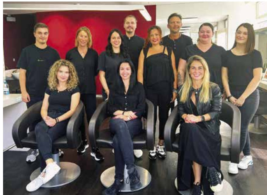
Das Team von Coiffure Achhammer freut sich auf Ihren Besuch.