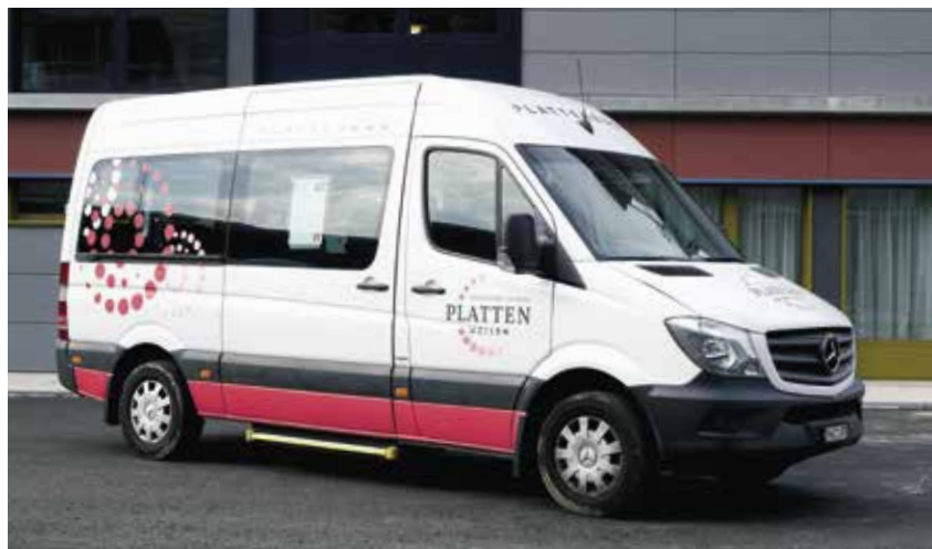
Der Plattenbus wird von freiwilligen Busfahrerinnen und Busfahrern gefahren.